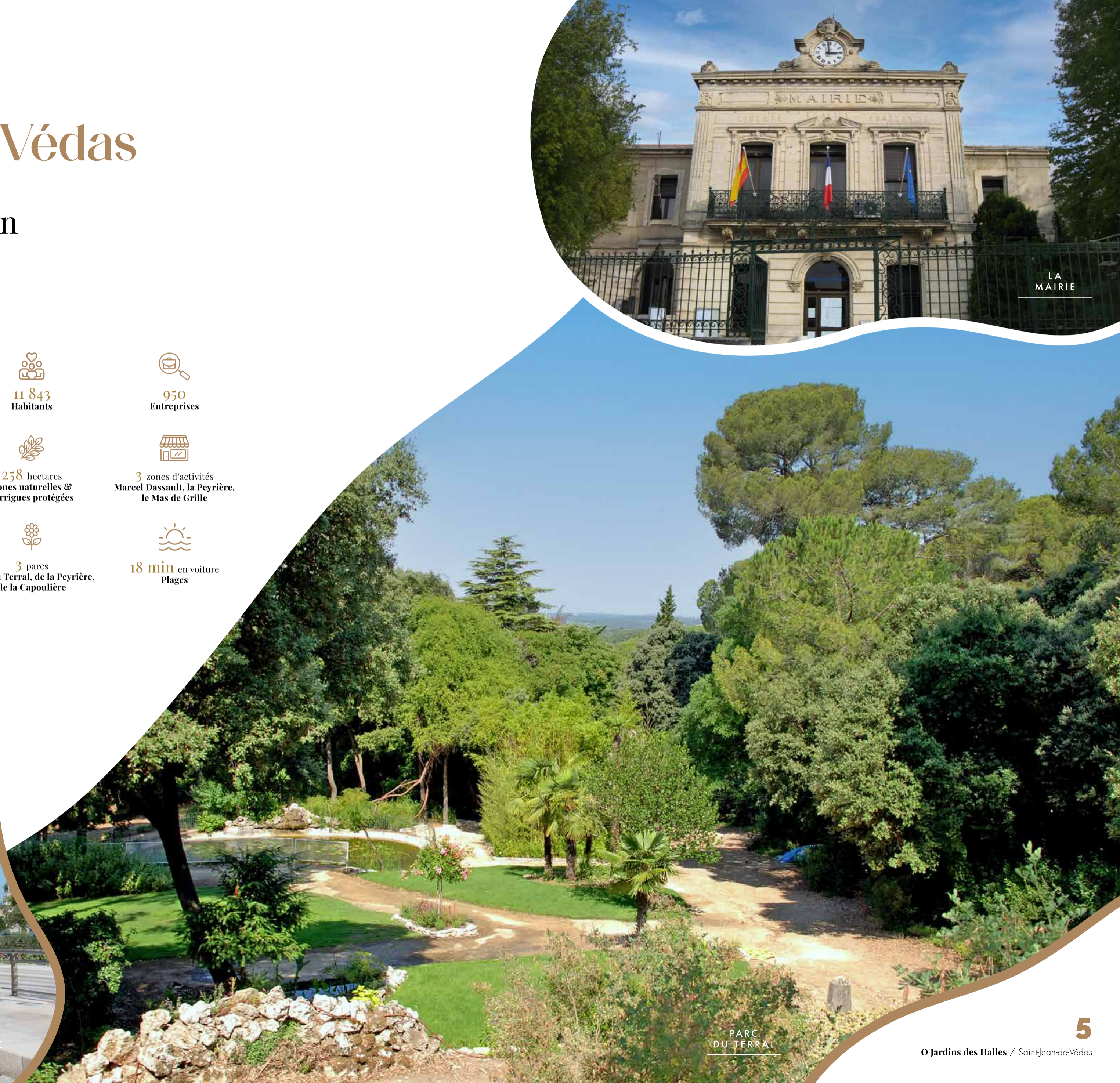
PARC DU TERRAL