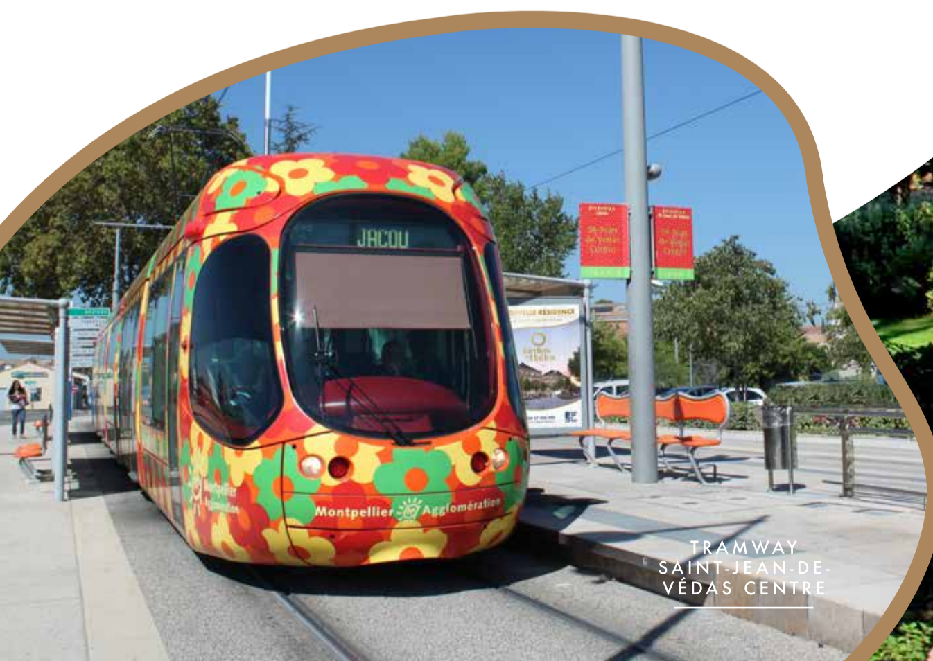
TRAMWAY SAINT-JEAN-DE- VÉDAS CENTRE